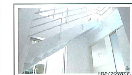
※同タイプの写真です。

物件概要●所在地/高知市福井町●開発面積/1,412㎡(427.13坪)●区画面積/1,412㎡(427.13坪)●地目/宅地●土地の権利形態/所有権●総区画数/10区画●販売区画/6区画●価格帯/坪単価(3.3㎡あたり)28万円~35万円●価格(1,187.76万円~1,503.14万円)●用途地域/第一種低層住居専用地域●建ぺい率/60%●容積率/100%●道路/W=4.9m・6m(アスファルト舗装)●交通/奥福井バス(徒歩3分)●設備/電気:四国電力株式会社・水道:公営水道、各区画合併浄化槽・瓦斯:各区画LP●売主/株式会社開成開発