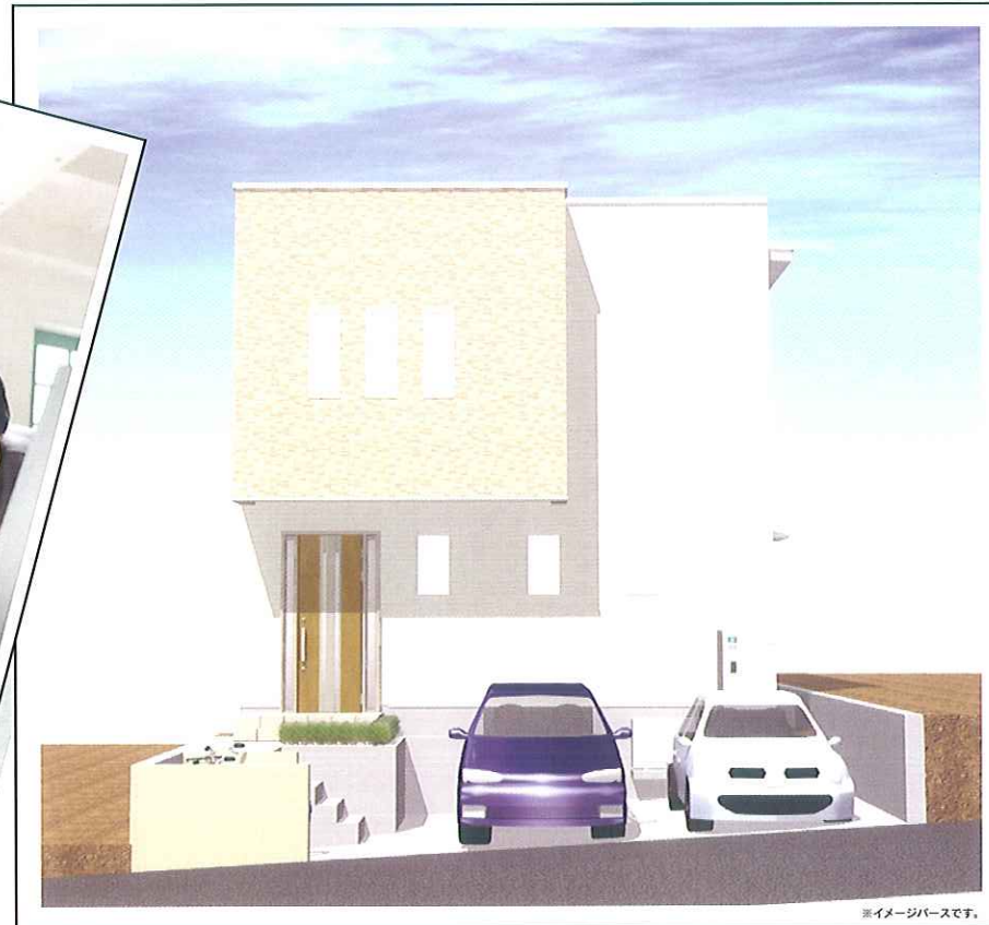
※イメージベースです。