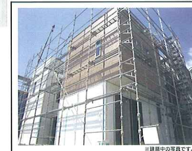
※建築中の写真です。