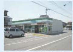
ファミリーマート(160m)