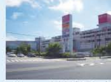
イオンモール高知(860m)