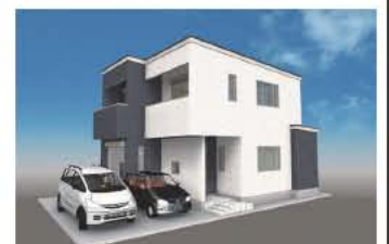
※イメージパースの為、実際とは多少異なります。