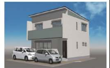
※イメージパースの為、実際とは多少異なります。