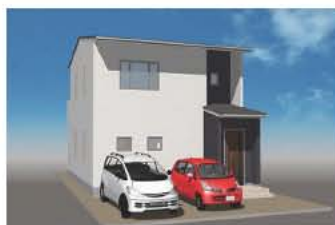
※イメージパースの為、実際とは多少異なります。