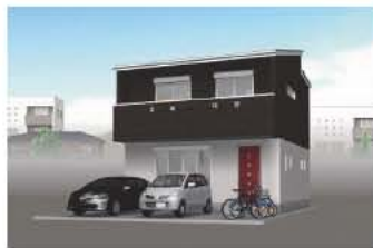
※イメージパースの為、実際とは多少異なります。

★日当たり良く、静かな環境 ★センス良くまとまった家です ★中心部にも近い(市役所800m)