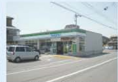
ファミリーマート(160m)