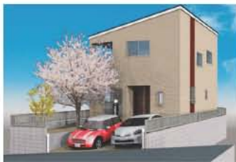
※イメージパースの為、実際とは多少異なります。