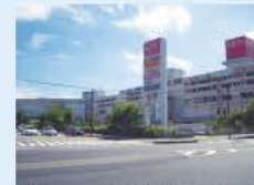
イオンモール高知(860m)