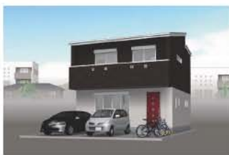
※イメージパースの為、実際とは多少異なります。

★日当たり良く、静かな環境 ★センス良くまとまった家です ★中心部にも近い(市役所800m)