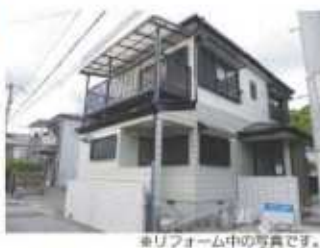
※リフォーム中の写真です。